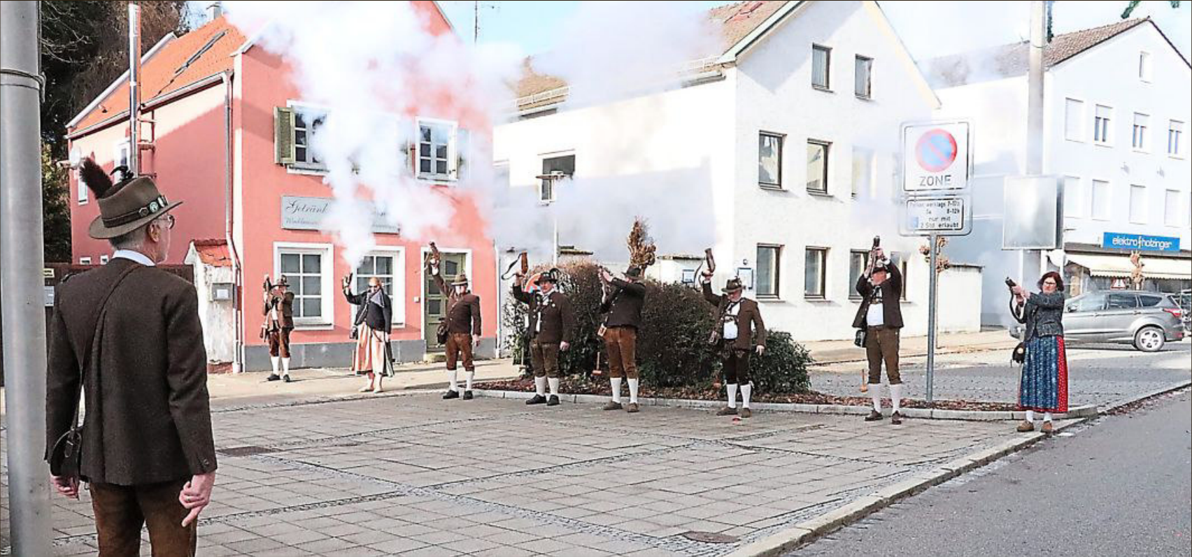
Mit drei Salutschüssen wurde das neue Jahr von den Bogener Böllerschützen begrüßt.