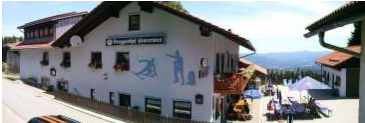
Berggasthof Hinterwies, Hinterwies 3, 94379 Sankt Englmar

Nach der Wanderung sind für uns Plätze im Berggasthof Hinterwies reserviert.