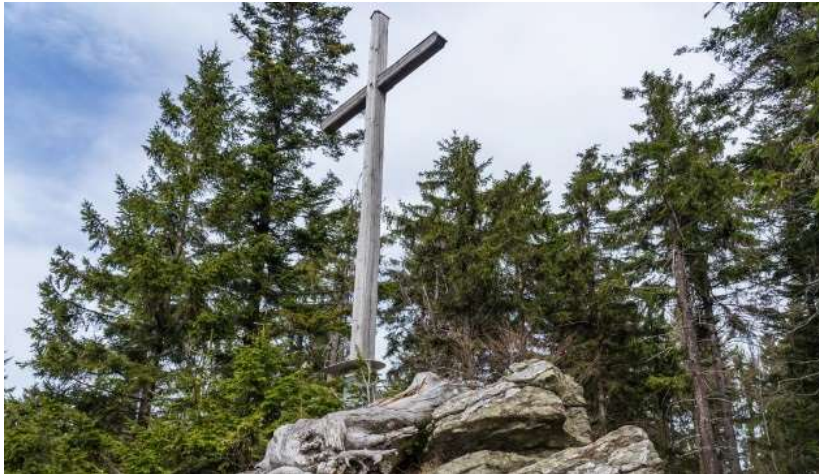
Gipfelkreuz des Knogl

Tour mit drei Gipfeln zum höchsten Punkt der Gemeinde St. Englmar – dem Knogl.